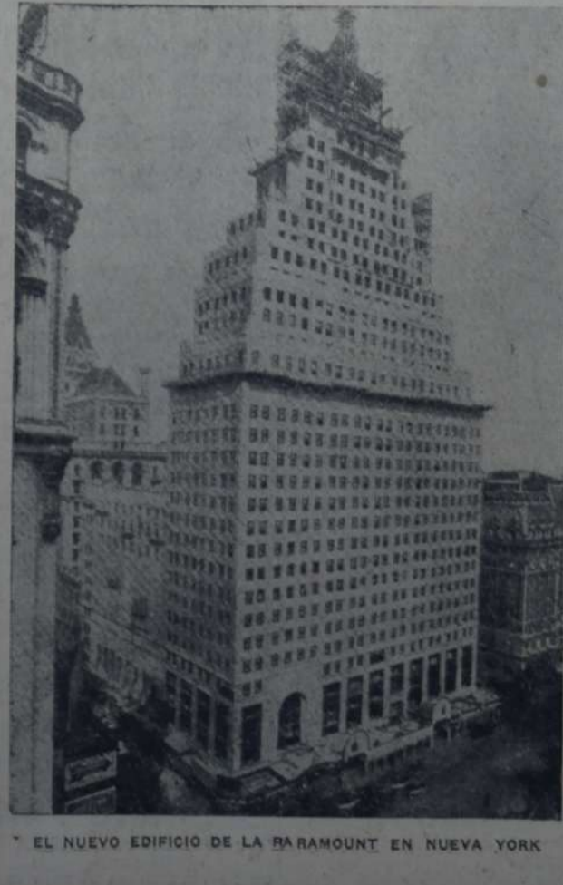
EL NUEVO EDIFICIO DE LA RAMMOUNT EN NUEVA YORK

LONDRES, 6. — Una estadística publicada por el ministerio de mines estima que durante el ejercicio de 1933, la caja de socorros de los mineros alcanzó a la suma de 7.582.100 libras esterlinas.