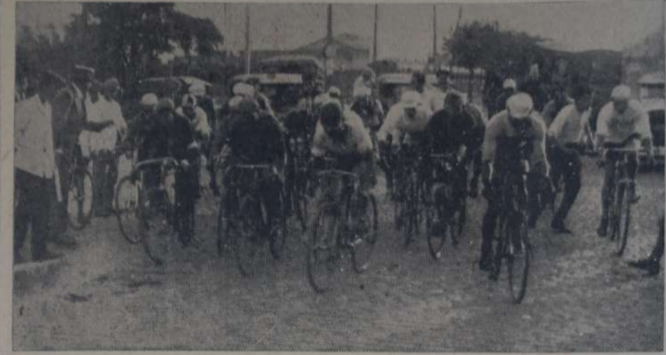
EN EL LUGAR DE LA LARGADA DE LA CARRERA CICLISTA "DOBLE LUJAN", VERIFICADA AYER.