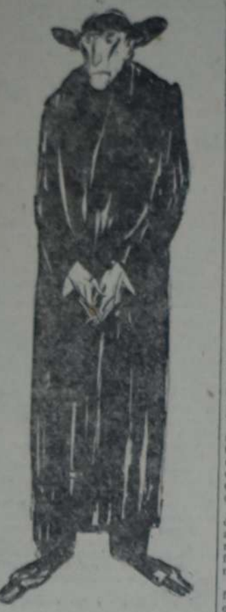
REPRODUCIMOS AQUI LA LEYENDA y el dibujo del hermoso cartel a gran tamaño preparado por "La Vanguardia" y que desde hoy está a disposición de los afiliados y centros para proceder a una gran pegatina.