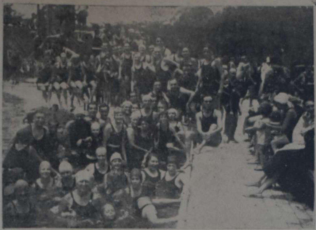
La pileta de natación del club Gimnasia y Esgrima, de su nuevo campo de deportes, congrega, principalmente los días festivos, numerosos aficionados al saludable deporte. Vemos aquí a un grupo de entusiastas nadadores en alegre camaradería.

A continuación se produce un prolongado peleo frente al arco visitante, al que pone fin Quilindro, al ejecut-