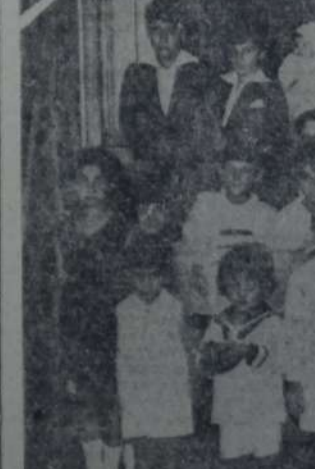
EN LA HERMOSA FIESTA REALIZADA EN EL CENTRO DE LA 7a., DONDE SE REPARTIERON JUGUETES A LOS NINITOS.

Las propiedades del gobierno de la nación ocupadas por sus oficinas públicas; las de legaciones extranjeras ocupadas por las mismas; las de los templos de todos los cultos las de sociedades de beneficencia que tengan personería jurídica, ocupadas por sus establecimientos, siempre que no posean otras propiedades de renta; las bibliotecas y sociedades deportivas con personería jurídica, por su edificio propio y ocupado por las mismas instituciones, siempre que no posean otras propiedades; las instituciones mutualistas con personería jurídica; los locatarios de mercados dedicados a la venta de productos de abasto exclusivamente; las cooperativas comprendidas dentro de la ley número 11.388; las asociaciones gremiales obreras con personería jurídica.