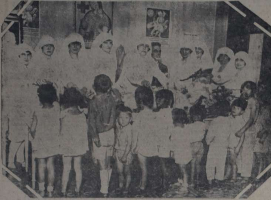
DURANTE EL REPARTO DE JUGUETES EFECTUADO POR LA CRUZ ROJA.