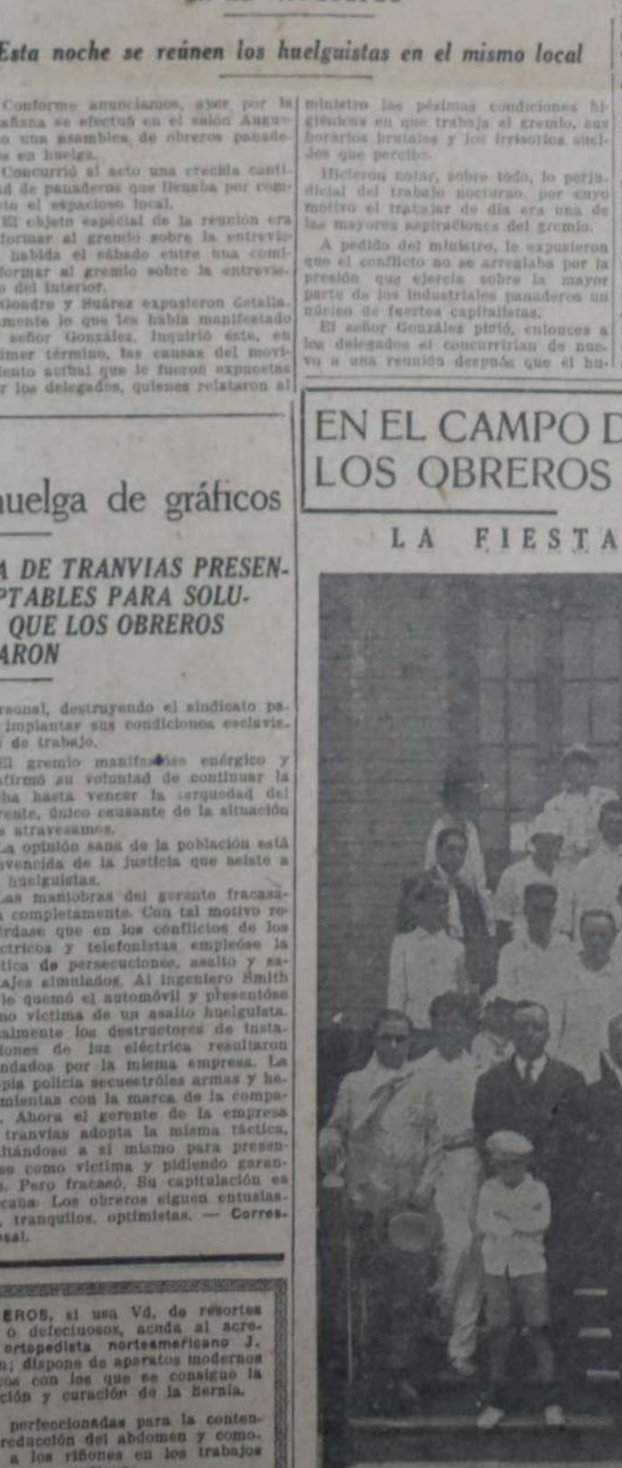
ANIMADA E INTERESANTE RESULTO LA FIESTA DEPORTIVA Y familiar celebrada ayer en el campo deportivo...